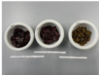
図1. ワイン残渣凍結写真(左から、キャンベルアーリー、マスカットベリー A、シャルドネ)